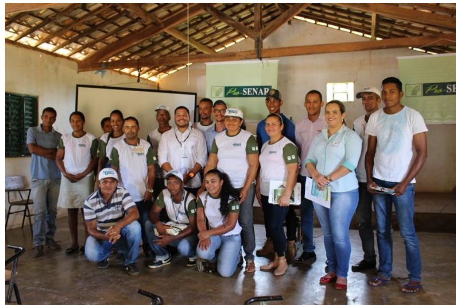
Pro-SENAR Mandioca em Angical

Workshop DIVULGAÇÃO DOS RESULTADOS DE PESQUISAS SAFRA 2016|2017