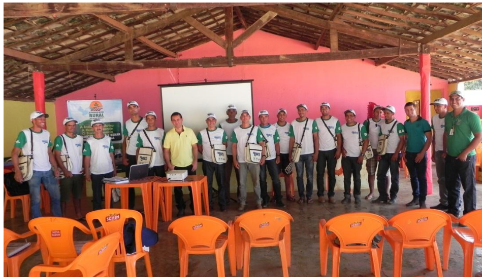
Pro-SENAR Leite em Angical

Workshop DIVULGAÇÃO DOS RESULTADOS DE PESQUISAS SAFRA 2016|2017