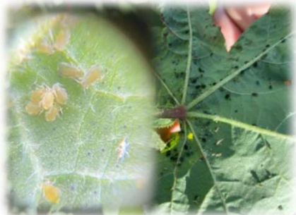
Pulgão-do-algodoeiro ( Aphis gossypii )