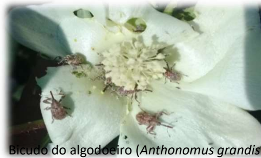
Bicudo do algodoeiro ( Anthonomus grandis ).