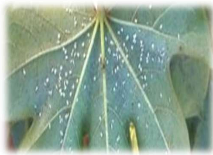
Mosca-branca ( Bemisia tabaci )