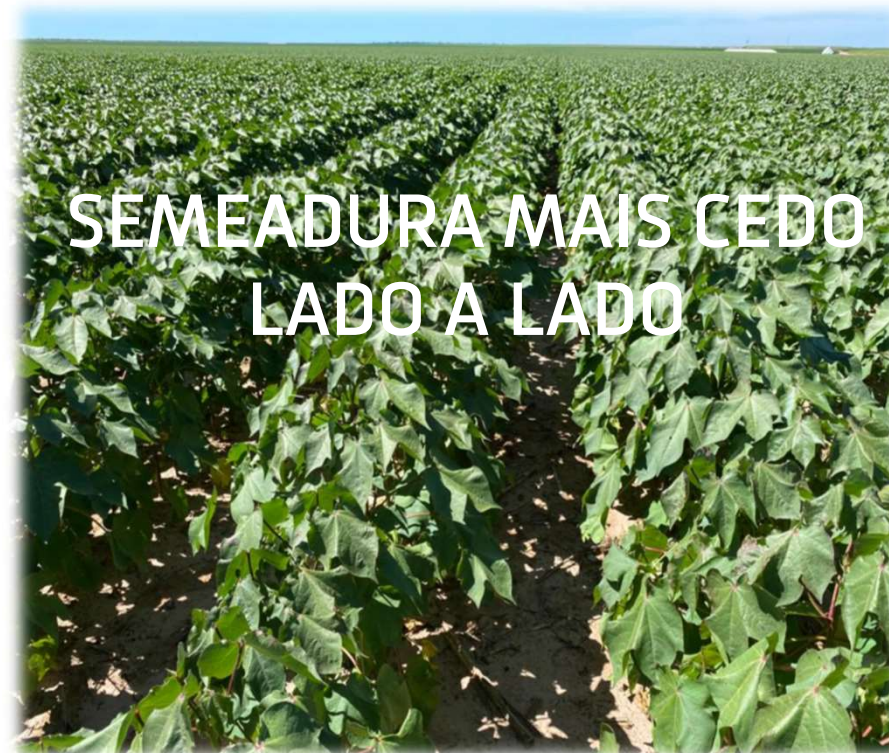
Lavoura pleno veranico – 42 dias sem chuvas – Rosário Correntina e Jaborandi – 2022/23