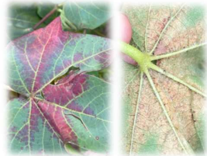
Ácaros ( Tetranychus urticae )